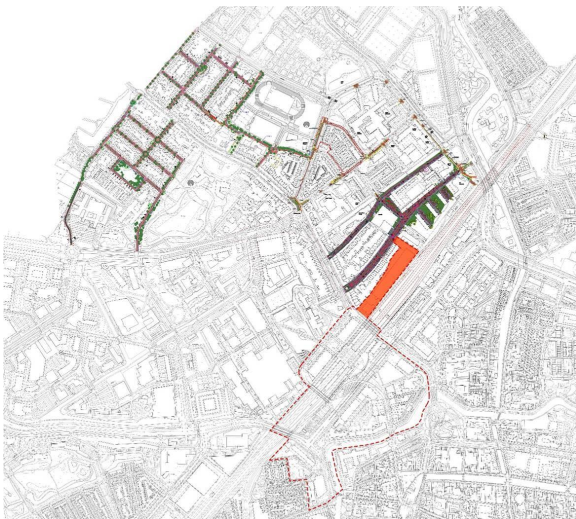
Schetsontwerp Masterplan Verkeer Houtkwartier in relatie tot raakvlakprojecten in de omgeving.