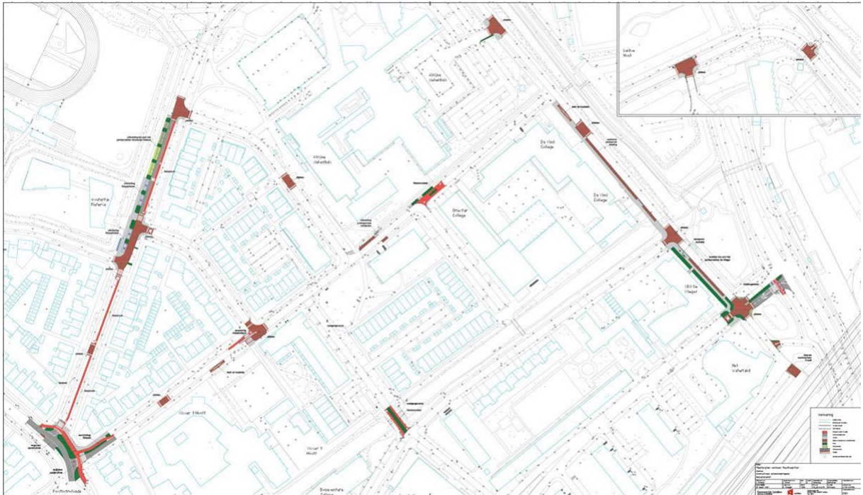
Voorstel projecten verkeersveiligheidsmaatregelen Houtkwartier (schetsontwerpen) welke hierboven ook zijn ingevoegd.