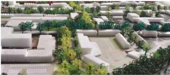
Maquettefoto groene ruggengraat, vanaf de Houtlaan gezien

erfafscheiding: haag rooilijn: minimaal 3 meter vanaf de erfgrans dakvorm: beperkte afwisseling in dakvorm hoogte: minimaal 3 lagen, maximaal 5 lagen (9-15 meter)