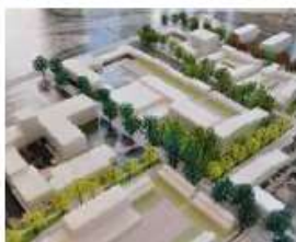
Openbaar raamwerk waarbinnen diverse modellen zich kunnen ontwikkelen